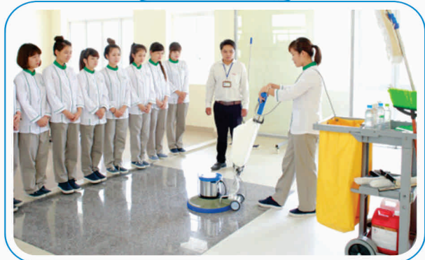
ビルクリーニング作業